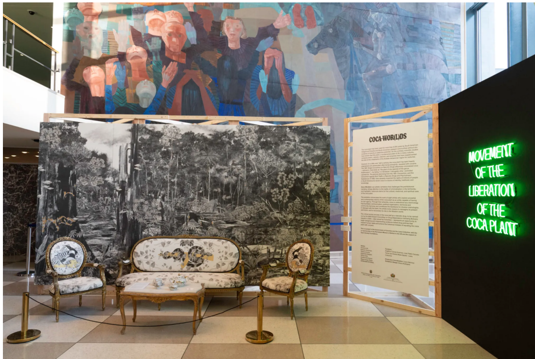
Vista de la exposición Coca, palabra-mundo en la Organización de las Naciones Unidas, Nueva York, 2024.

Av. Juárez y Eje Central, Lázaro Cárdenas Centro Histórico de la Ciudad de México